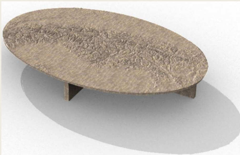
Illustration des Bronzereliefs