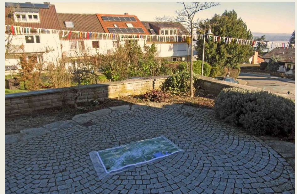
Vorgesehener Platz vor dem Litzelstetter Rathaus