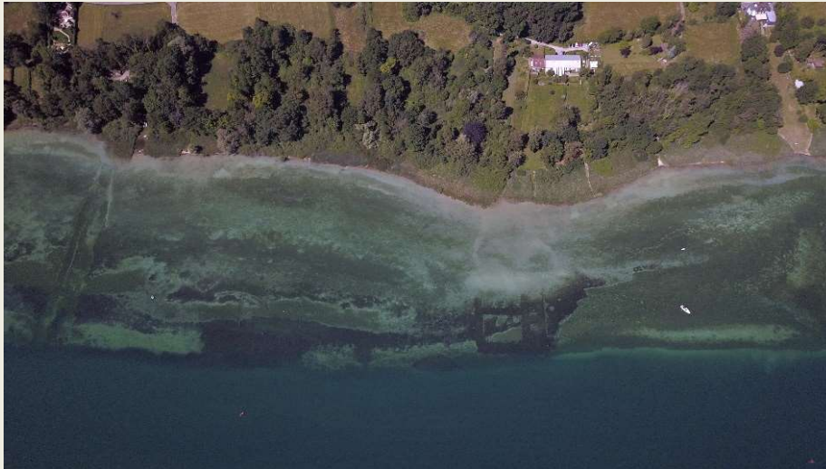
UNESCO Pfahlbau-Welterbestätte Krähenhorn