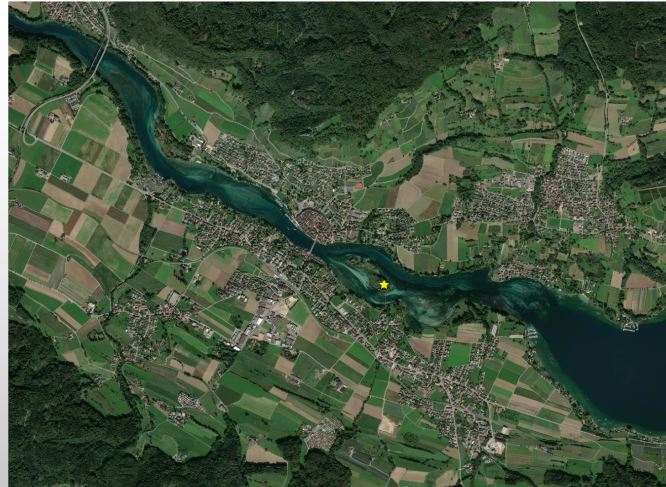
Lage: Insel im Bodenseeausfluss kurz vor Stein am Rhein