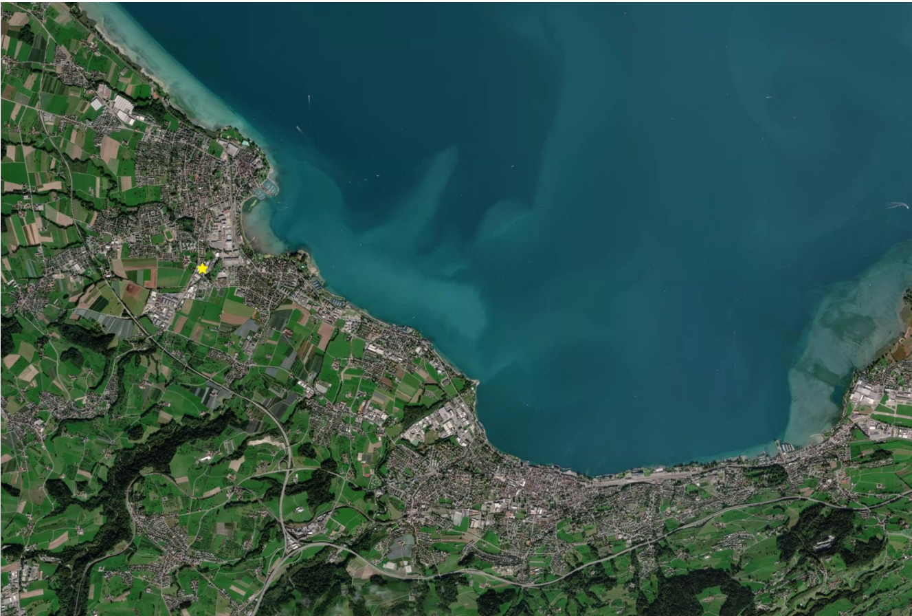
Lage: südlich der Altstadt von Arbon